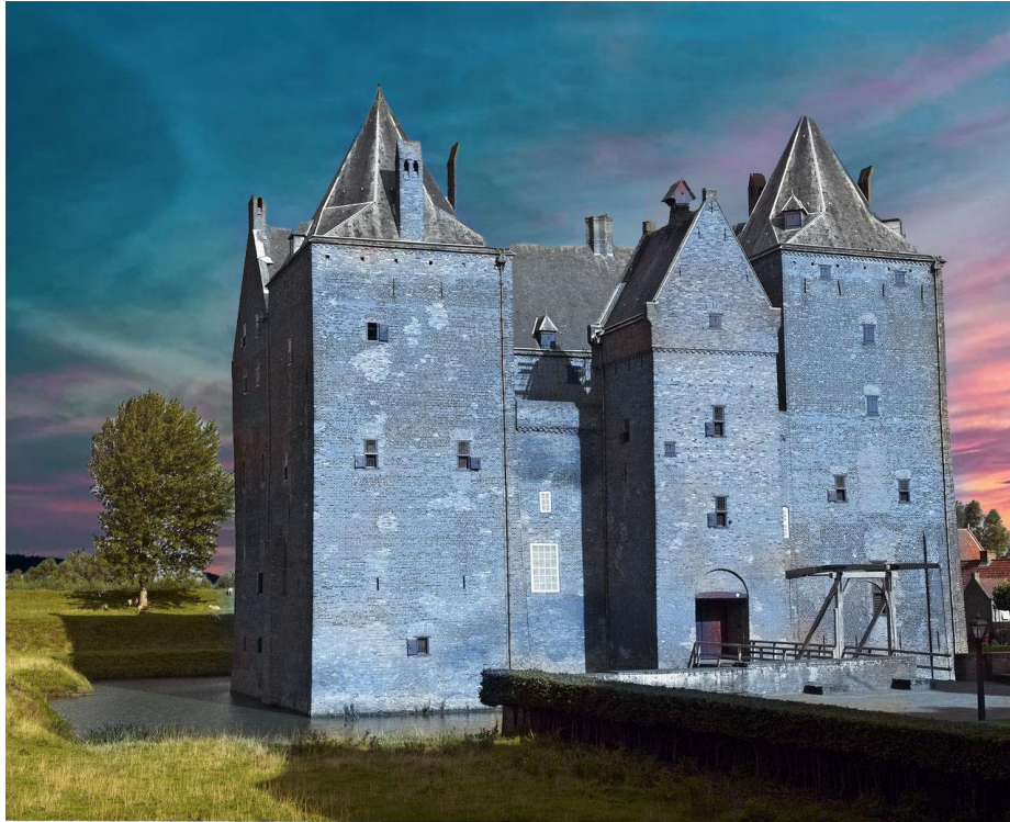
Slot Loevestein, gemeente Zaltbommel